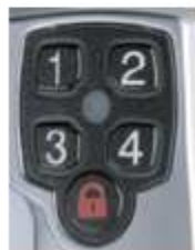
Vihreän valon palaessa näppäile voimassa oleva sekä uusi koodi ohjeen mukaan.