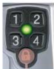
Paina 5 - 6 sekuntia